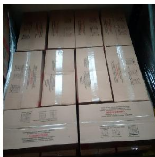
Lastro B: 10 caixas