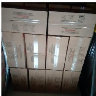
Lastro A: 10 caixas

Padrão de empilhamento Empilhamento caixa sobre caixa: máximo 10 caixas